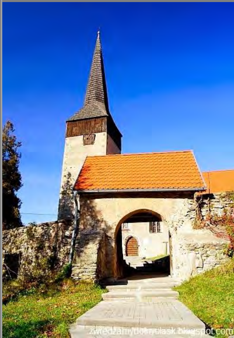
Kościół św. Jadwigi

Wędrując przez wieś spotkamy liczne pamiątki historii: kościół św. Jadwigi z XIII w. , otoczony murem kamienny , stary cmentarz. Wieś znana jest z krzyży pokutnych , których jest tu aż pięć.