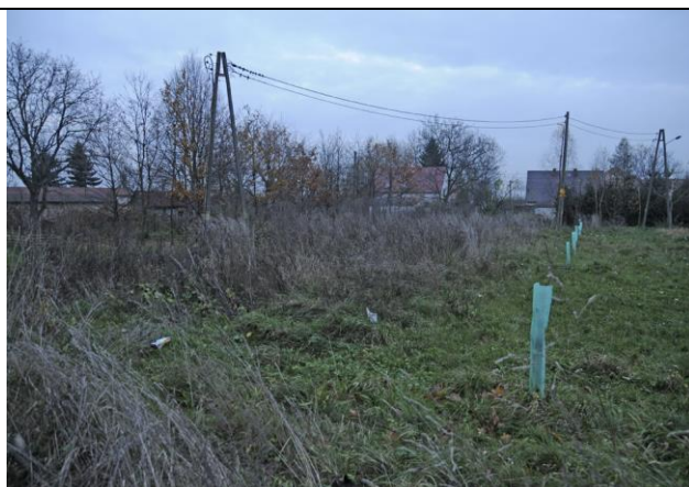
Fot. 2 Miejsce przyszłych nasadzeń.