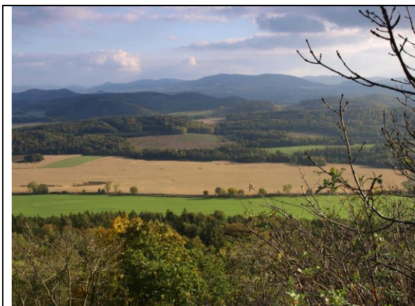
Fot. 1 Widok na Pogórze Kaczawskie.

Ernestynów – wieś w Polsce położone w województwie dolnośląskim, w powiecie złotoryjskim, w gminie Złotoryja. Miejscowość znajduje się w obrębie Pogórza Kaczawskiego. Na terenie miejscowości działa lokalne stowarzyszenie „Nasz Ernestynów”.