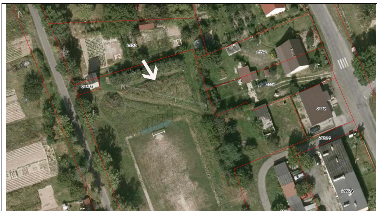
Rys. 1 Lokalizacja ścieżki.

Na terenie miejscowości warto rozważyć szersze działania mające na celu propagowanie wiedzy o zapylaczach poprzez stworzenie ścieżki edukacyjnej poświęconej temu zagadnieniu. Warto rozważyć możliwość wplecenia tego tematu w istniejącą infrastrukturę turystyczną, a także aktywizację sztuki rękodzieła – np. tworzenie domków dla owadów, rzeźb owadów z występującego tam materiału (piaskowca) etc.