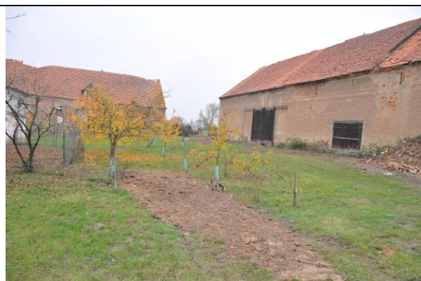
Fot. 2 Zabudowa jednego z gospodarstw.