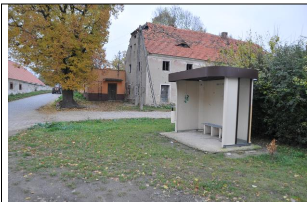
Fot. 1 Centrum miejscowości.

Wieś położona jest w województwie dolnośląskim, w powiecie jaworskim, w gminie Wądroże Wielkie. Na terenie miejscowości znajduje się kilka zabytkowych obiektów – zabudowania folwarczne oraz pałac z połowy XVI w. Historia miejscowości sięga początków XIII w. W miejscowości prężnie funkcjonuje społeczność lokalna.