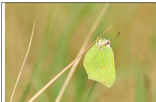
Fot. 8 Latolistek cytrynek