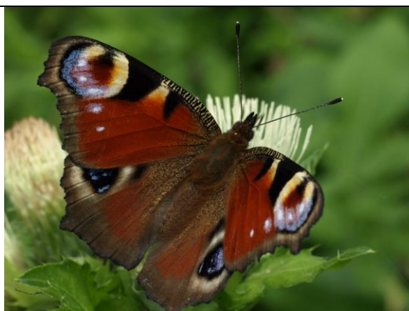
Fot. 11 Rusałka pawik