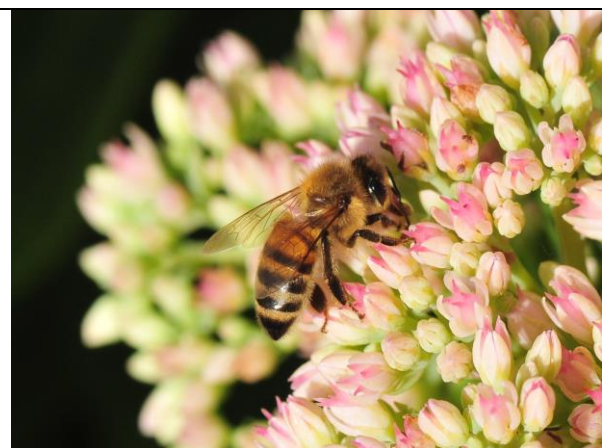
Fot. 10 Pszczoła miodna