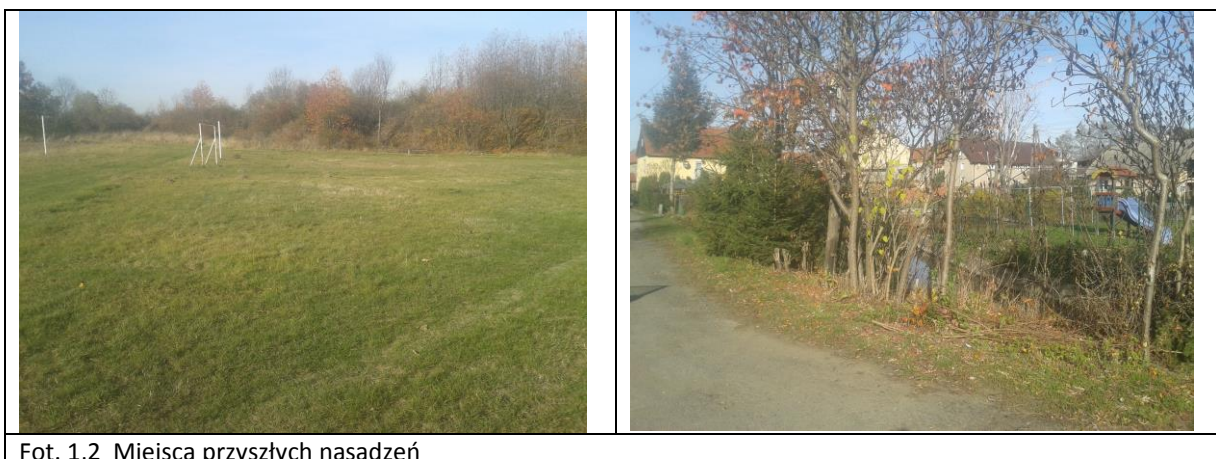
Fot. 1,2 Miejsca przyszłych nasadzeń