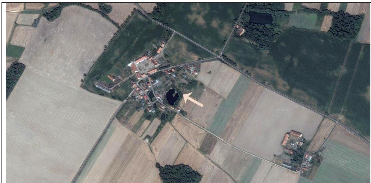
Rys 1 Lokalizacja nasadzeń.

Nasadzenia zostały zlokalizowane na rozległej działce udostępnionej społeczności lokalnej przez gminę. W pobliżu ma zostać utworzone boisko typu Orlik oraz altana. Nasadzenie zaprojektowano w formie szpaleru drzew, a także grup krzewów. Z uwagi na zaplanowane roboty budowlane lokalizację nasadzeń ograniczono do stref wyjętych spod inwestycji. Po zakończeniu robót proponowane jest wykonanie kolejnych nasadzeń. Altana ma zostać obsadzona pnączami.