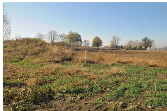
Fot. 2 Miejsce przyszłych nasadzeń, w tle widoczny zabytkowy dąb.