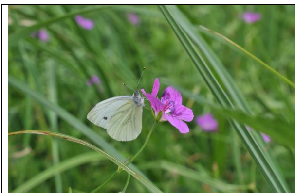
Fot. 6 Bielinek bytomkowiec