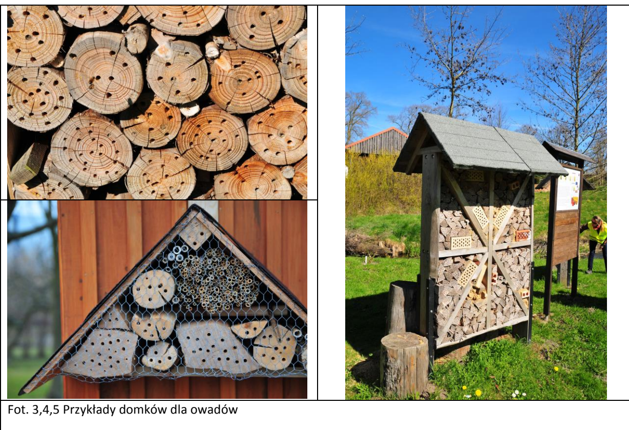
Fot. 3,4,5 Przykłady domków dla owadów