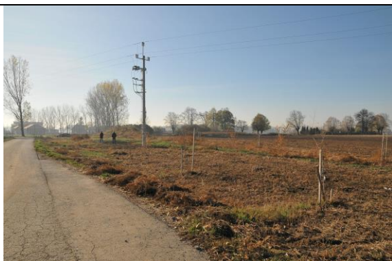
Fot. 1 Rzeka skora na odcinku przepływającym przez wieś.

Chrzanów to niewielka miejscowość leżąca ok. 8 km na południe od Wrocławia. Wieś ma charakter tzw. ulicówki. Większość budynków zlokalizowana jest wzdłuż ul. Lipowej. Wzdłuż drogi przed miejscowością posadzone zostały jesiony, w samej wsi lipy. Miejscowość jest dobrze skomunikowana, w pobliżu przebiega droga krajowa nr 8, która łączy się z S8. Wokół wsi dominują grunty orne oraz niewielkie powierzchnie lasów. W miejscowości prężnie funkcjonuje społeczność lokalna.