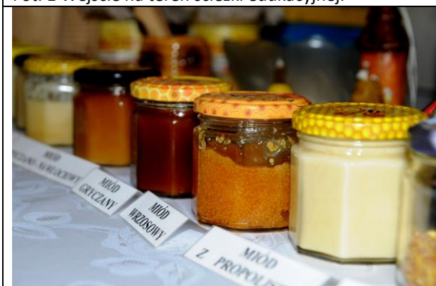
Fot. 3 Lokalna produkty pszczele.