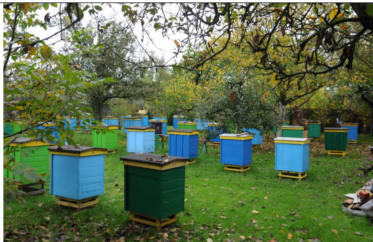
Fot. 5 Lokalna pasieka.