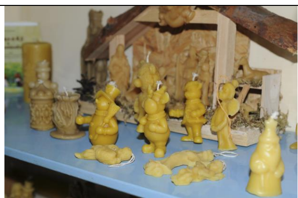
Fot. 2 Ekspozycja na terenie ścieżki.