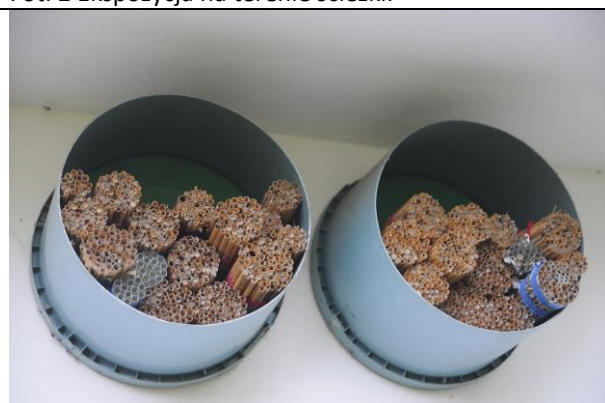
Fot. 4 Zasiedlone domki przez murarkę ogrodową.