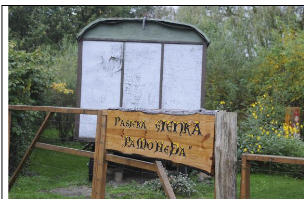
Fot. 1 Wejście na teren ścieżki edukacyjnej.

Na terenie miejscowości, na terenie prywatnej pasieki w 2012 roku stworzona została również ścieżka edukacyjna „Pasiekę Gienka” poświęcona pszczołom. Główną ideą utworzenia edukacyjnej ścieżki pszczelarskiej była chęć przekazywania dzieciom i młodzieży oraz innym zainteresowanym historii, kultury i tradycji związanej z pszczelarstwem dawnych lat, a także rolą pszczół dla człowieka i przyrody.