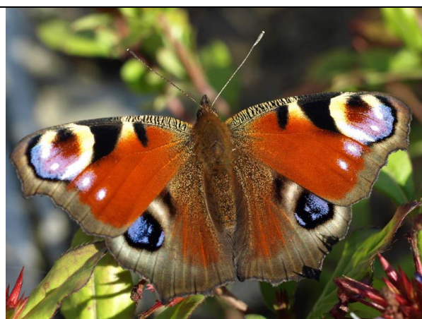
Fot. 8 Rusałka pawik.