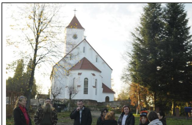
Fot. 1 Dawny kościół ewangelicki z XVII w.

Na terenie miejscowości działa Stowarzyszenie Wolimierz. Celem stowarzyszenia jest wspieranie wszechstronnego rozwoju społecznego, kulturowego i gospodarczego wsi Wolimierz, wspieranie demokracji i budowania społeczeństwa obywatelskiego w lokalnej społeczności.