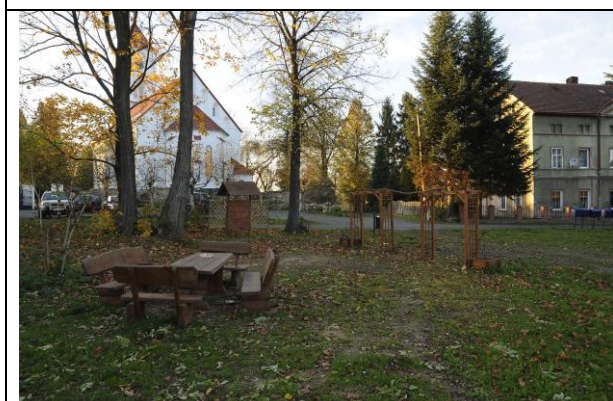
Fot. 3, 4 Miejsca przez przyszłe nasadzenia.