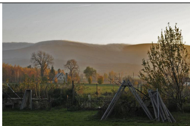
Fot. 2 Lokalny krajobraz stanowi jedną z najważniejszych lokalnych atrakcji.