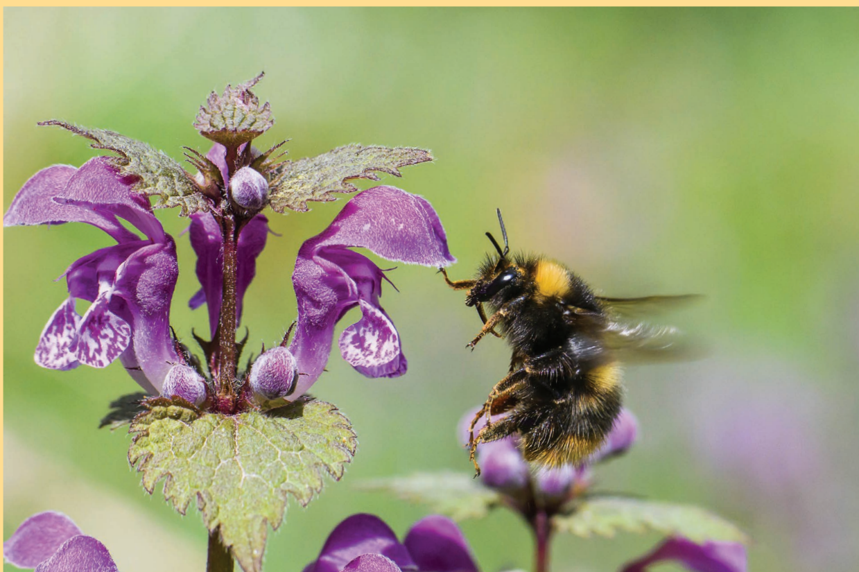
Trzmieł ziemny oblatujący kwiaty jasnoty plamistej

Podniesienie w społeczeństwie wiedzy na temat przyczyn zaniku owadów zapylających w otaczającym nas krajobrazie, a także poznanie zagrożeń (zarówno tych naturalnych jak i związanych z działalnością człowieka) pozwala na wypracowanie sposobów minimalizacji negatywnych oddziaływań na zapylacze. Zwiększona w tym zakresie świadomość społeczna może pozytywnie wpłynąć na zmianę postrzegania problemu spadku liczebności owadów zapylających i chęć angażowania się zainteresowanych przyrodą osób w ich skuteczną ochronę.