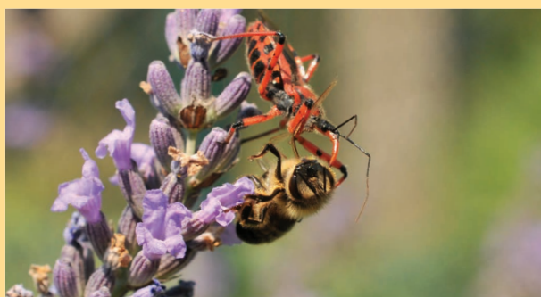
Srogoń baldaszkowiec z upolowaną pszczołą