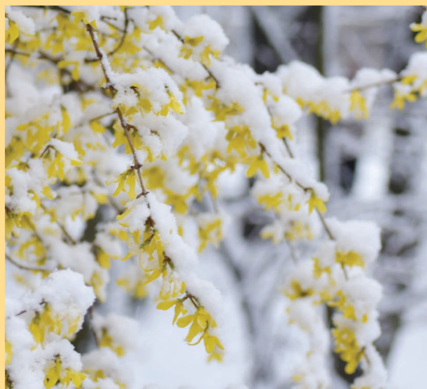
Anomalie pogodowe są zagrożeniem dla wielu zapylaczy

Przyczyny zaniku populacji owadów zapylających mają swe źródło zarówno w środowisku przyrodniczym (naturalne zagrożenia), jak też w szeroko rozumianej działalności człowieka. Wśród naturalnych oddziaływań oprócz zmian klimatycznych (ocieplenie), skutkujących np. zaburzeniami okresów kwitnienia czy zmienną pogodą, na dzikie zapylacze mają wpływ naturalni drapieżcy,