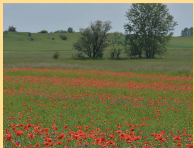
Kwitnące chwasty są ważnym źródłem pokarmu zapylaczy pomiędzy okresami kwitnienia upraw.