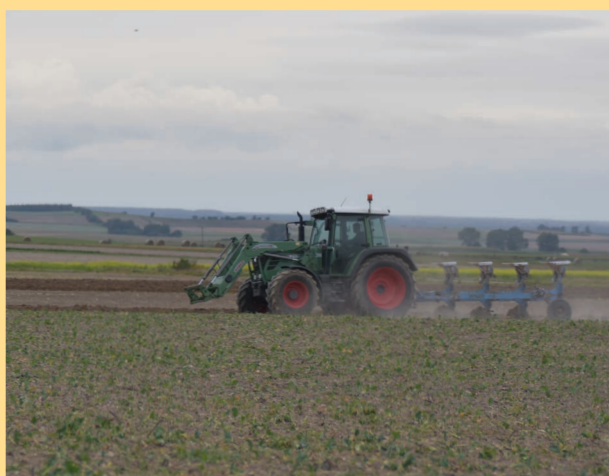
Intensywna gospodarka rolna nie sprzyja przyrodzie...

Obok nich istotną rolę odgrywają czynniki mające bezpośredni związek z działalnością człowieka. Jednym z głównych zagrożeń zapylaczy jest chemizacja. Stosowane powszechnie w rolnictwie środki ochrony roślin (insektycydy, herbicydy) stanowią śmiertelne niebezpieczeństwo dla wszelkich bezkręgowców. Szczególnie niebezpieczne dla pszczół są neonicotynoidy (neuroaktywne insektycydy), które z uwagi na swoją neurotoksyczność prowadzą do śmierci wielu gatunków owadów. Badanie przeprowadzone w 2012 sugeruje, że neonicotynoidy mogą niekorzystnie wpływać na wzrost kolonii trzmieli i płodność królowej, co może mieć związek z ogólnościowym zmniejszeniem liczby dzikich pszczół. Niekorzystnie na zapylacze wpływa także zakładanie w rolnictwie monokultur. Nie tylko ograniczają one różnorodność pokarmu (pyłek + nektar od jednego tylko gatunku uprawianej rośliny, np. rzepaku), ale także zabierają przestrzeń innym roślinom miododajnym (określanym często mianem chwastów). Powstają tym samym tzw. pustynie pożytkowe, na których zapylacze nie znajdą pokarmu poza okresem kwitnienia uprawy monokulturowej. Tego