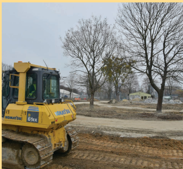
Utrata siedlisk to najważniejsza przyczyna zanikania zapylaczy